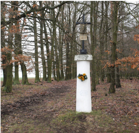
4. KŘÍŽEK HAJNÉHO TOMÁŠE POKORNÉHO