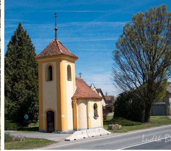
3. KAPLE SV. FLORIANA BDENĚVES