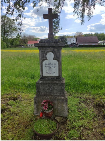
1. KŘÍŽEK V MYSLINCE