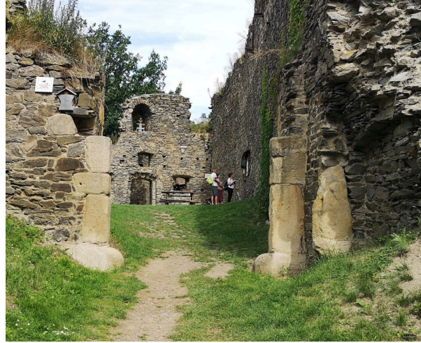
2. ZŘÍCENINA HRADU BUBEN